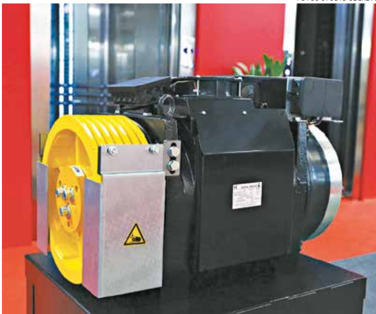
Gearless: sem uso de óleo e economia de até 40% de energia elétrica