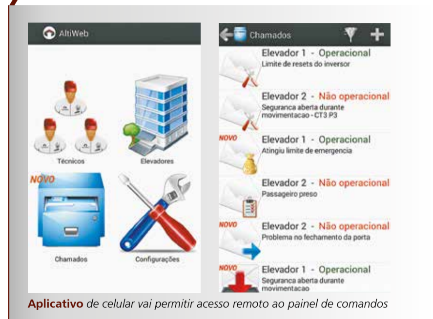
Aplicativo de celular vai permitir acesso remoto ao painel de comandos